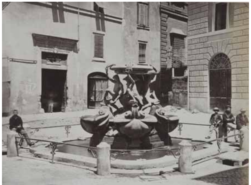
Romualdo Moscioni (attr.), La fontana delle Tartarughe a piazza Mattei , albumina, 1875 circa, cm. 18.7x25.1