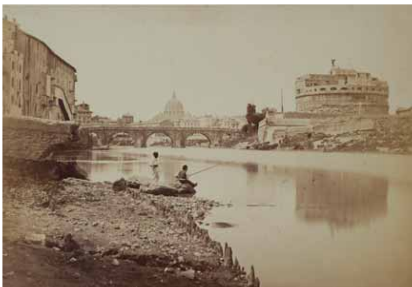
Gioacchino Altobelli, Veduta di Castel Sant'Angelo con San Pietro sullo sfondo albumina, 1870 circa, cm. 25.2 x 36.7