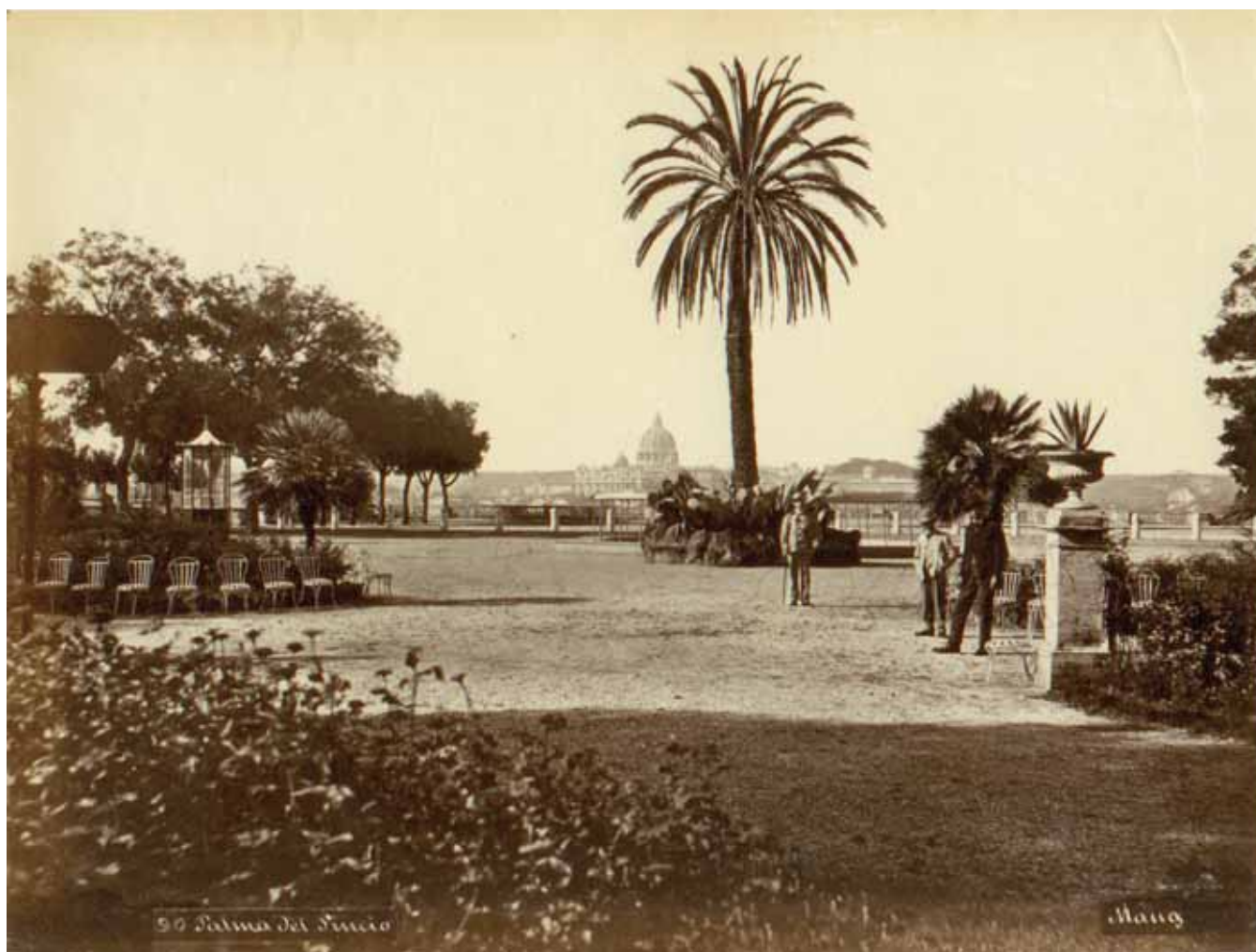
Michele Mang, Piazzale del Pincio , albumina, 1880 circa, cm. 19.4x25.4