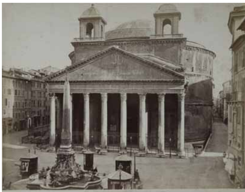
Romualdo Moscioni, Veduta del Pantheon , albumina, 1875 circa, cm. 20.4x26.1