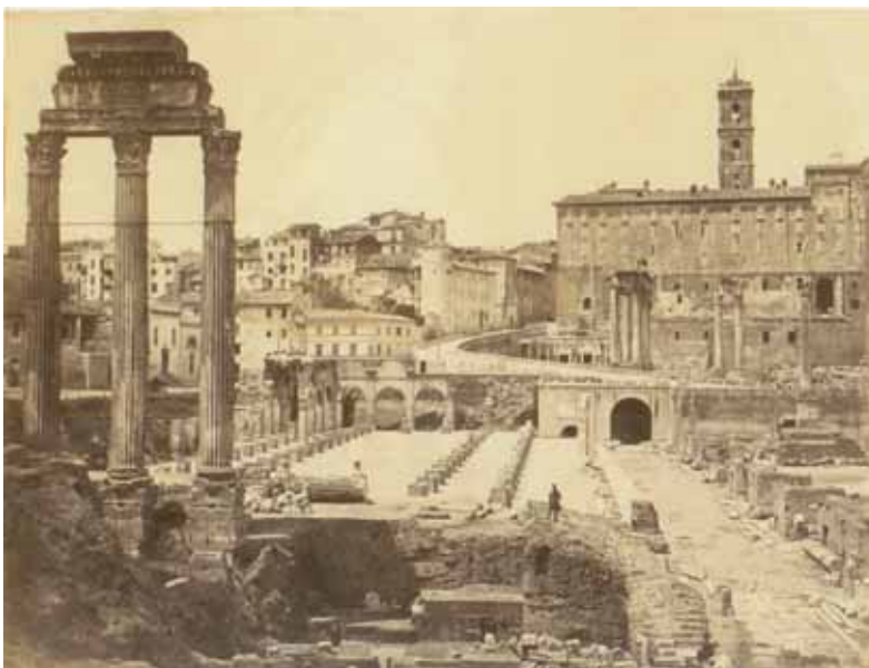
Pompeo Molins, Il Foro Romano verso il Campidoglio , albumina, 1875 circa, cm. 20.2 x 26.2