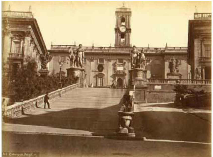
Michele Mang, La cordonata del Campidoglio con la via delle Tre Pile , albumina, 1860/65, cm. 19.2 x 25.3