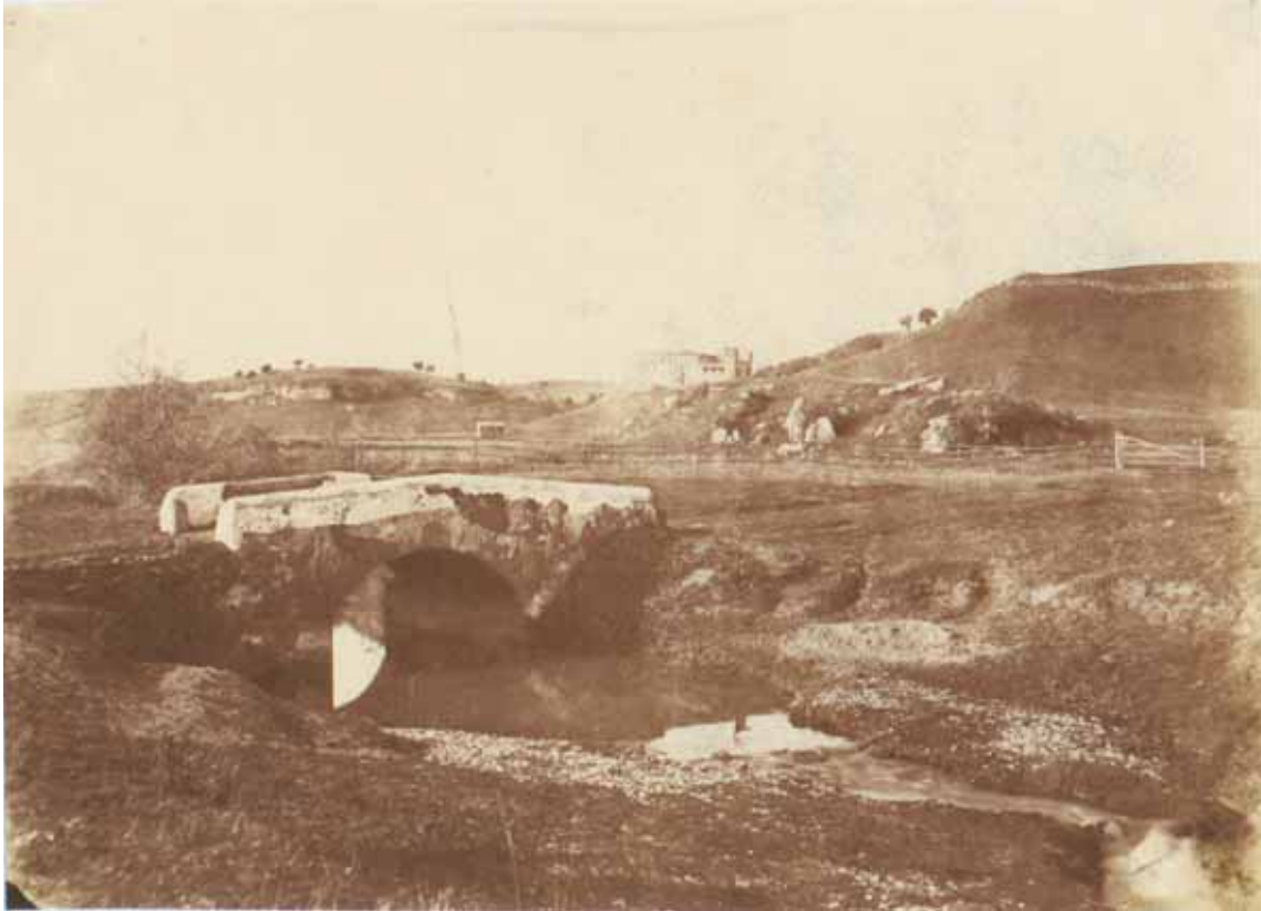
Giacomo Caneva, Veduta del ponticello sul fosso della Crescenza , calotipo, 1852, cm. 20x27.4