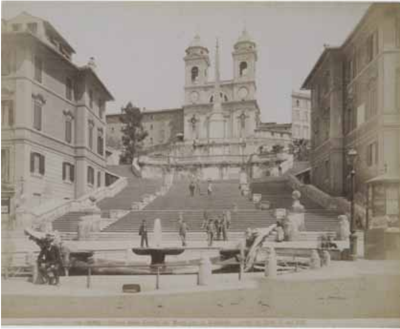
Cesare Vasari, La scalinata di Trinità de' Monti con la Barcaccia , albumina, 1880 circa, cm. 20x24.8