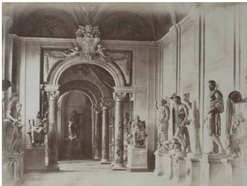
Robert MacPherson, Musei Vaticani: la Sala dei Filosofi , carta salata albuminata, 1855/60, cm. 29.7x39.8