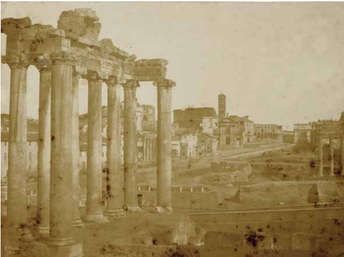
Frédéric Flachéron, Veduta del Tempio di Saturno con il Foro Romano , carta salata da calotipo, 1850, cm. 25.1x33.7