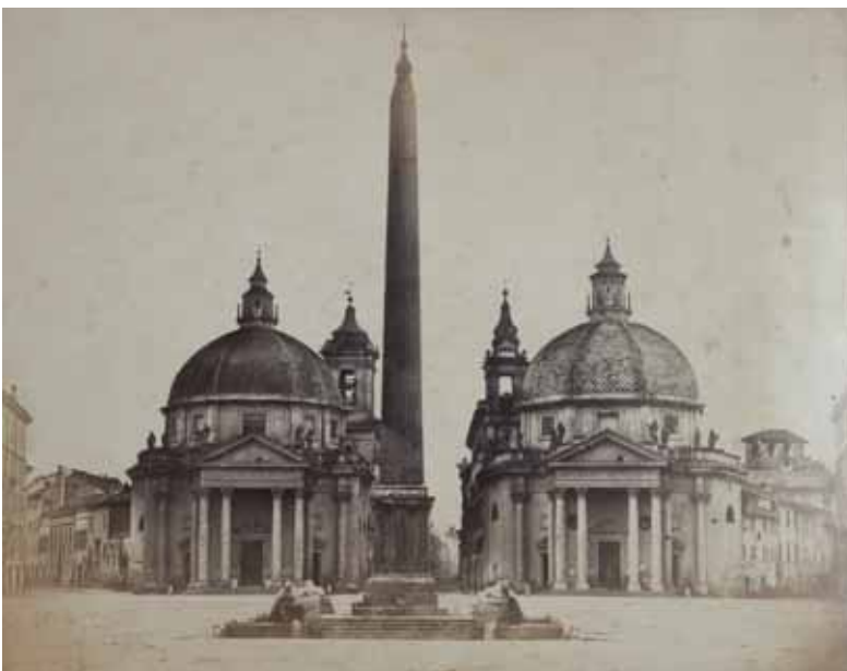
Pietro Dovizielli (attr.), Veduta di piazza del Popolo , carta salata albuminata, 1855/60, cm. 30.4x39.2