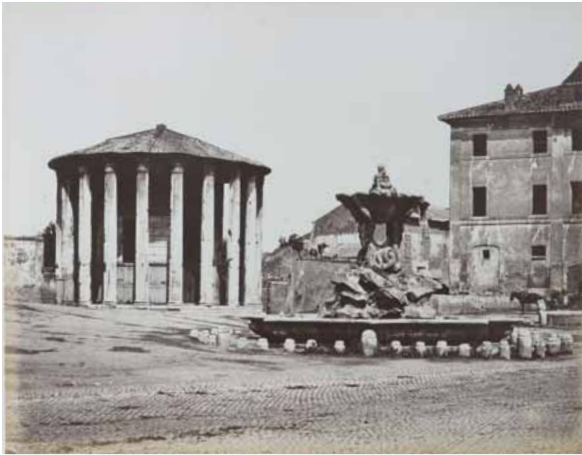
Autore non identificato, Il cosiddetto "tempio di Vesta" con la fontana del Bizzaccheri , albumina, 1880 circa, cm. 18.4x24.3